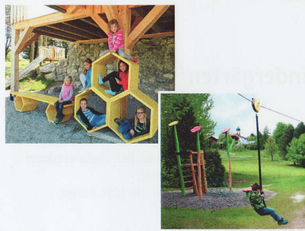
1. Auflage-14-11-01 - gültig für 2015

Kleine und größere Bienenkinder können mit den beiden auf Entdeckungstour gehen. Im Dorfanger, direkt am Bienen-Erlebnispfad und der Minigolfanlage, kann getobt und gespielt werden.